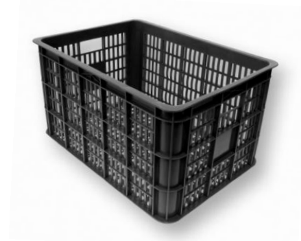
Transportkiste „Krate“ à la Amsterdam 19,90 EUR