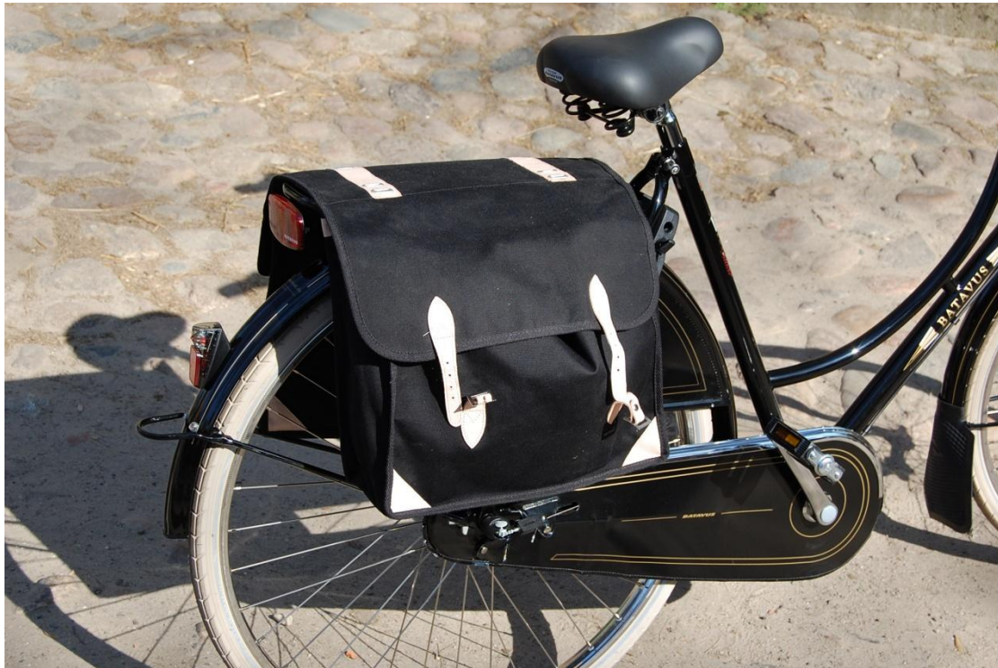
CANVAS Tasche schwarz 28,90 EUR