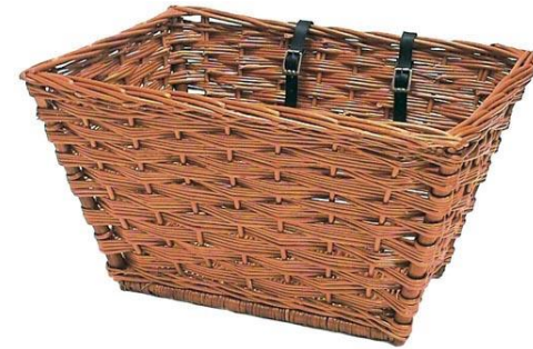
Weidenkorb Darwin XL 48 EUR