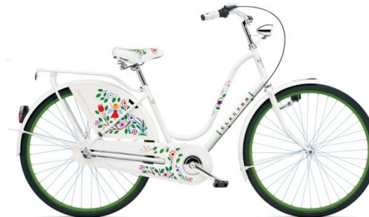
tree of life.