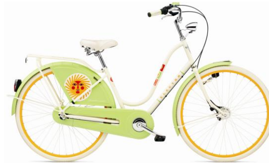
la fonda del sol.