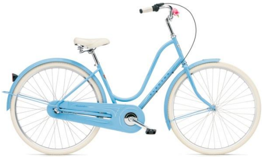
powder blue ladies'.