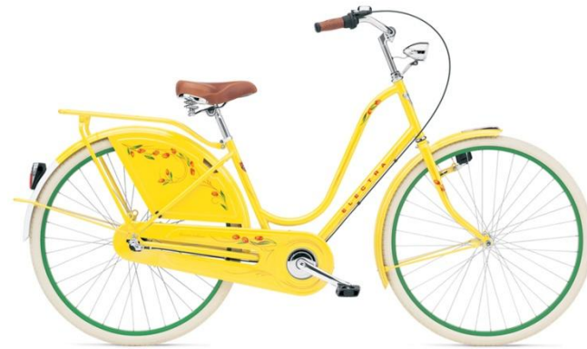
yellow tulip ladies'.